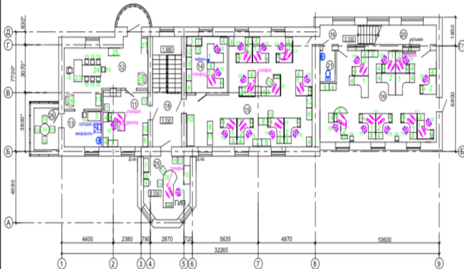
План на отм. 3,330